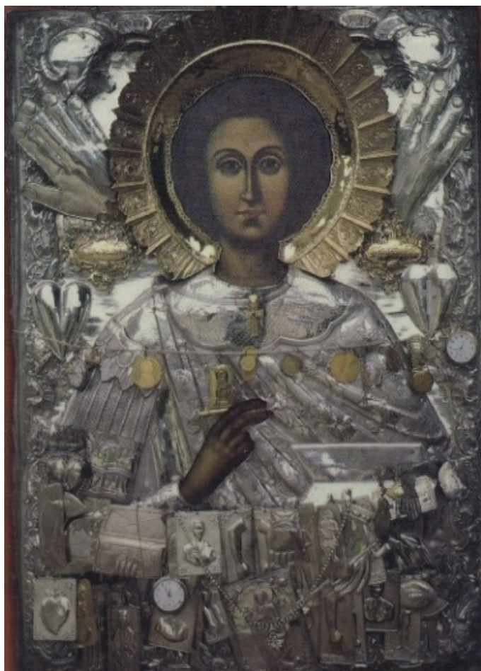
Holy Great Martyr and Healer, Panteleimon, 304 AD.

Величаем тя, страстотерпече святыи великомучениче и целбниче Пантелеимоне, и читим честная страдания твоя, яже за Христа претерпел еси.