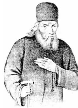
Старец Никон Сушкинский

Старец Никон (Щербаков) родился в 1764 году в деревне Кирицы Спасского уезда Рязанской губернии. Старец скончался 28 декабря 1844 года.